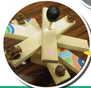
箸置き ツリー (クラフト)