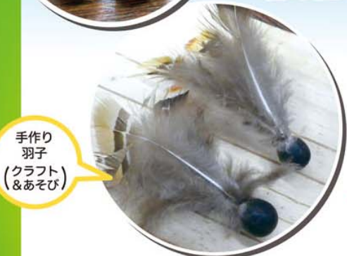
手作り 羽子 (クラフト &あそび)