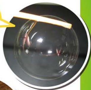
天然の シャボン玉 (あそび)