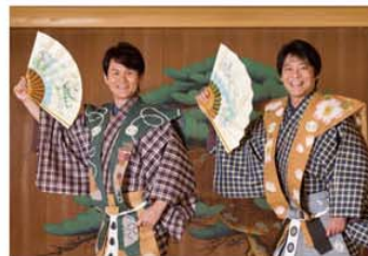
企画制作:萬狂言 制作協力:ワイルドビジョン 協力:マセキ芸能社は出演者事務所

会場 ● 区立文化会館大ホール 取扱店 ● 区立文化会館、3面のチケット取扱店 料金 ● (全席指定) 3,000円 ※未就学児の入場はお断りさせていただきます。